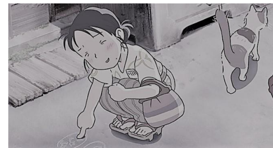
Dans un recoin de ce monde de Sunao Katabuchi